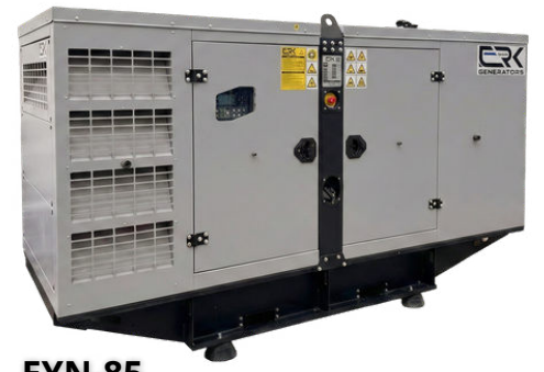
EYN-85 المواصفات الفنية